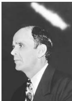
William Marrion Branham: Um Profeta Enviado por Deus

"Por meio de um profeta, o Senhor fez subir Israel do Egito, e por um profeta foi ele guardado" Oséias 12.13