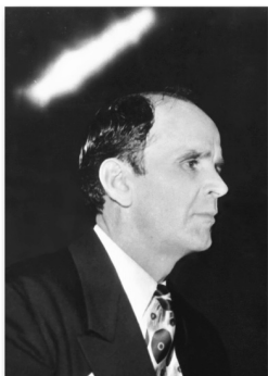
William Marrion Branham: Um Profeta Enviado por Deus

“Por meio de um profeta, o Senhor fez subir Israel do Egito, e por um profeta foi ele guardado.” Oséias 12.13